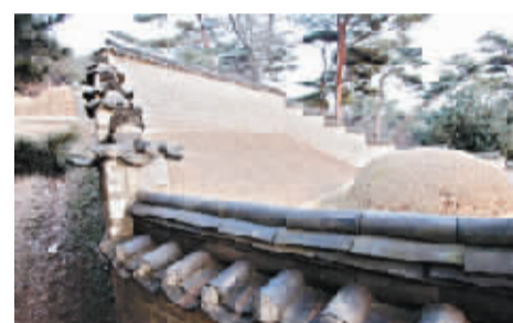
至今尹、沈两家墓地仍以一面高墙相隔。